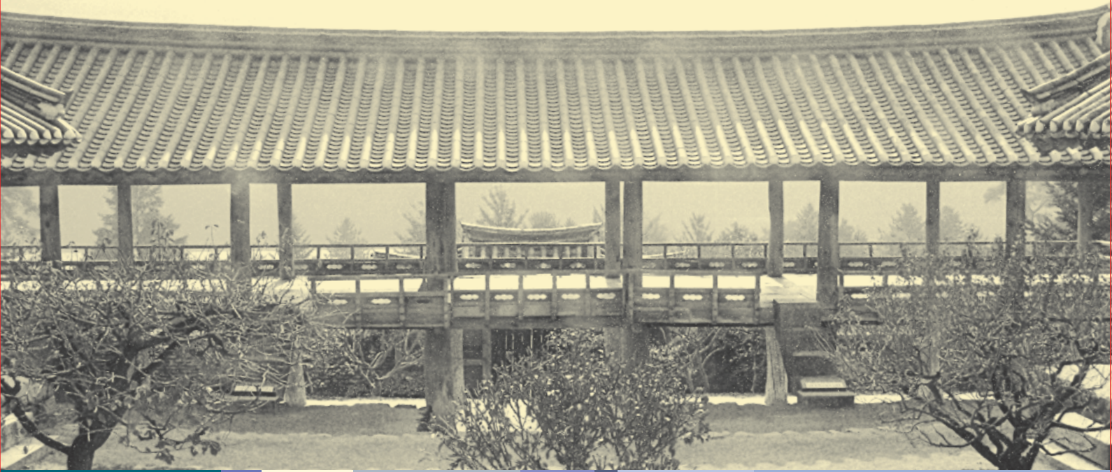
● 안동 명산서원(屏山書院) 만대루(晩對樓) - 조선시대 자연주의 건축의 격조(格調)