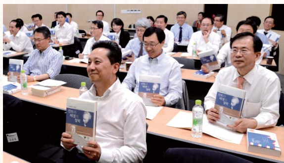
Participants of Seoul National College of Humanities' Ad Fontes Program hold up their textbooks during a class on Tuesday.

Popularity of the liberal arts drives people and businesses to return to classic books and attend related classes