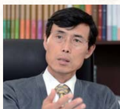
Participants of Seoul National College of Humanities' Ad Fontes Program hold up their textbooks during a class on Tuesday.

Universities, public libraries at the forefront of humanities programs